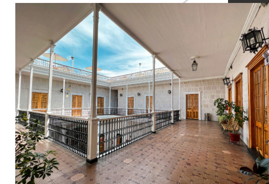
BALCONES PRIMER PATIO